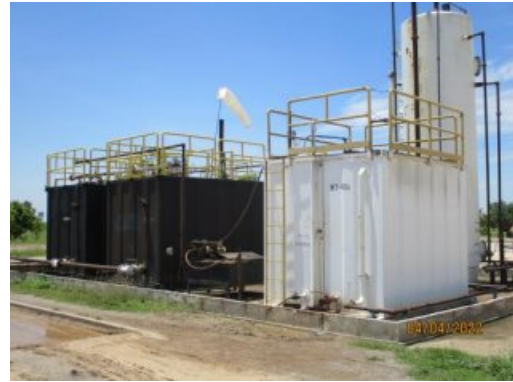
รูปที่ 1-2 สภาพของพื้นที่ฐาน WBNE-C ในระยะผลิตปิโตรเลียม