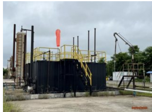
รูปที่ 1-3 สภาพของพื้นที่ฐาน WBNE-A ในระยะผลิตปิโตรเลียม