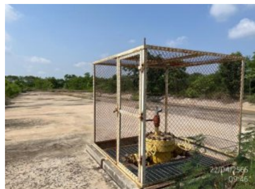
รูปที่ 1-4 สภาพของพื้นที่ฐาน WBNE-B ในระยะพักหลุม (Shut in)